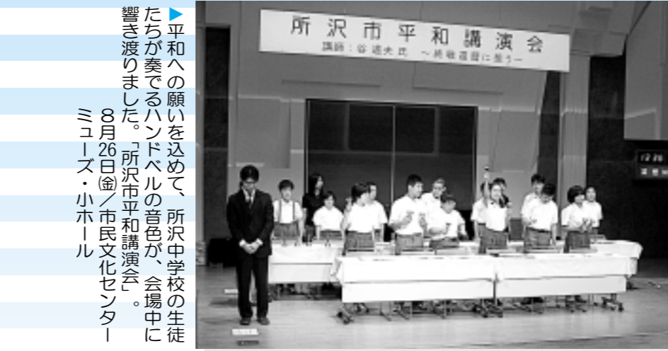
▶平和への願いを込めて、所沢中学校の生徒たちが奏でるハンドルの音色が、会場中に響き渡りました。「所沢市平和講演会」の26日（金）/市民文化センター・三コープ・小ホール