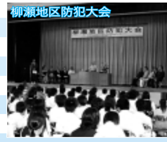
柳瀬地区防犯大会

このように城自治会には、歴史のある遺跡や史跡とともに地域住民の活動を支えるふれあいや語り合いが残り、これからそのよい伝統を子や孫にも伝えていきたいと考えています。