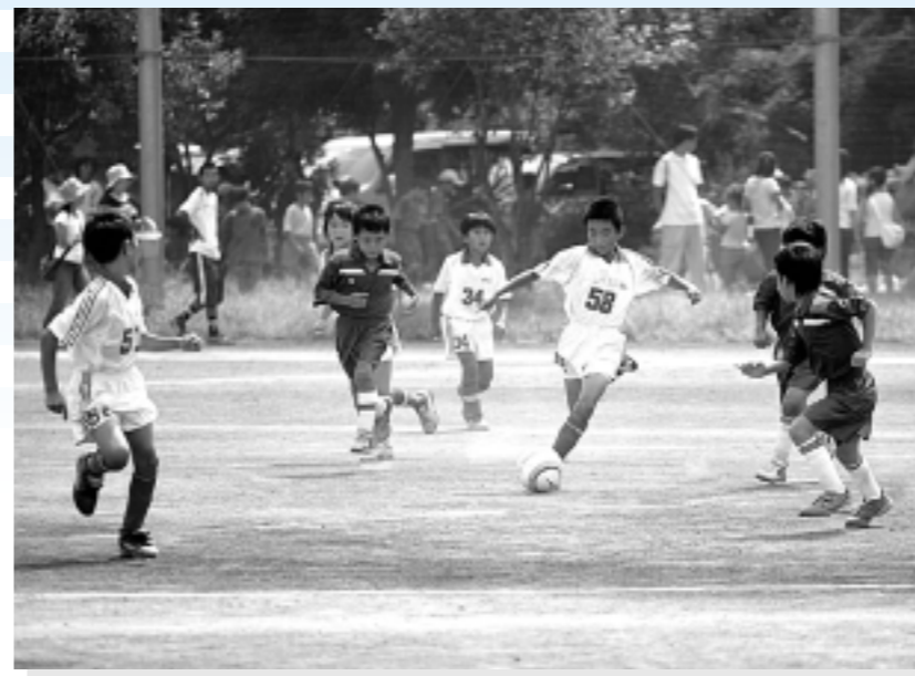
▶元元よくピッチを駆け回るサッカー少年たち。夢はJリーガー！「所沢市少年サッカー大会」。9月3日（土）/北中運動場