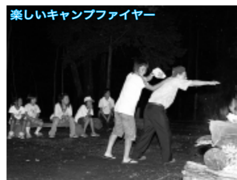
楽しいキャンプファイヤー

「遠い山や川まで出かけなくても、所沢近郊には雑木林や湿地などが残っています。また、近所の