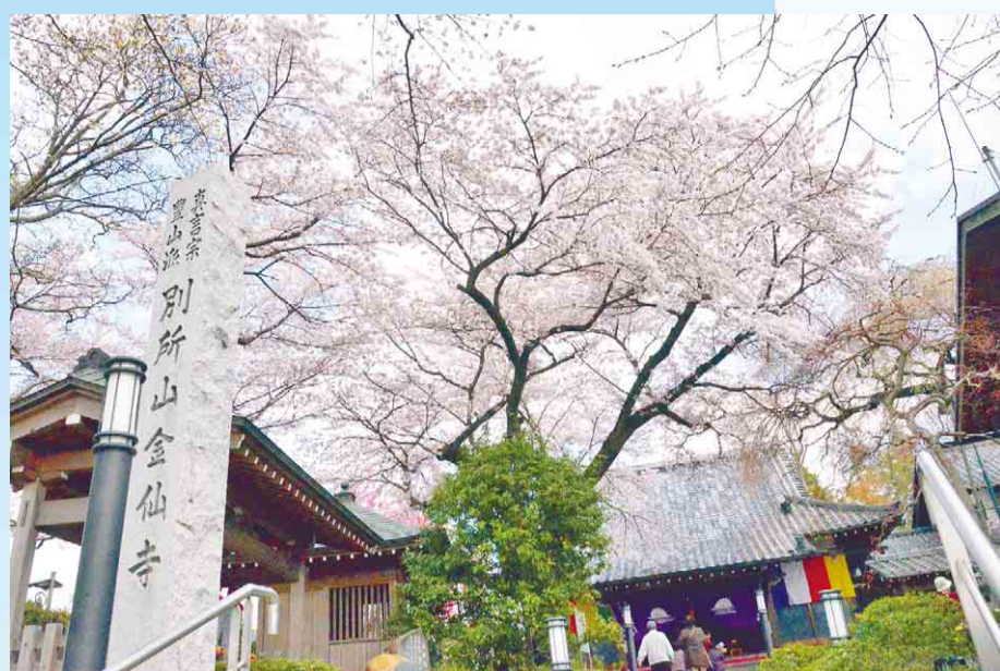
▲樹齢約150年のしだれ桜で知られる金仙寺で行われた『金仙寺桜まつり』。あいにくしだれ桜は見ごろを過ぎていましたが、ソメイヨシノが満開の中、和太鼓・三味線の演奏や野菜の直売などが行われ、多くの人が訪れました。 4月6日(日)／金仙寺(堀之内)