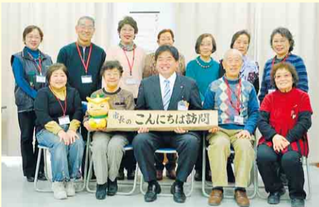
▲お達者クラブ・リンクの皆さん