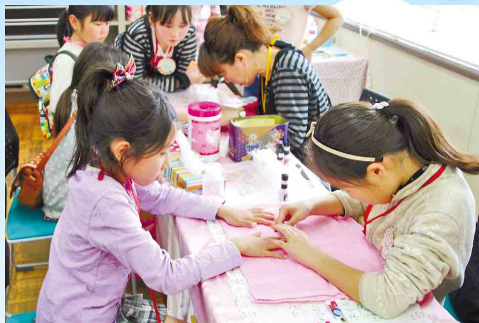
▲「子どもがつくる こどものまち」をテーマに開催された『トコトコタウンV』。ネイルサロンや雑貨店、飲食店など自分のしたい仕事を探したり、もらったタウン(給料)で買い物をしたりと、生活の仕組みについて楽しく学んでいました。 3月29日(土)／生涯学習推進センター