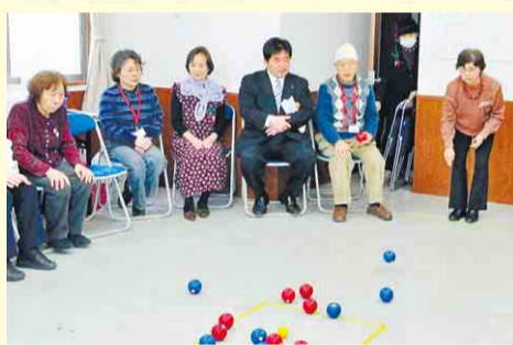
▲レクリエーション(ボッチャ)の様子