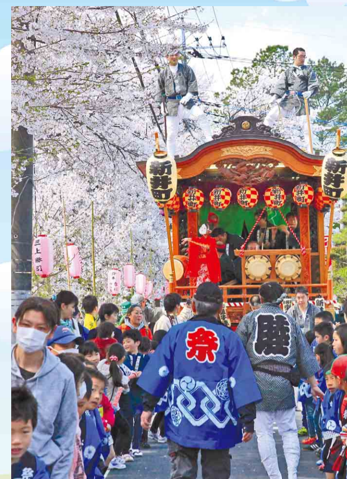
▲好天に恵まれ、桜も満開の中で開催された「東西新井町さくら祭り」。東川沿いの桜並木は市内の観光スポットでもあり、当日は山車のパレードも行われ、たくさんの方がお花見とお祭りを楽しみました。また、熊野神社ではよさこいのパフォーマンスなどもありました。 4月5日(土)／熊野神社(西新井町)ほか