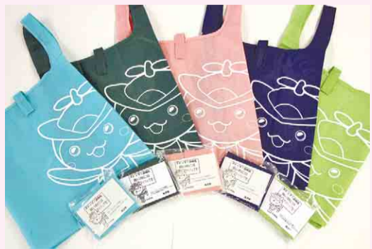
▲「トコロん」エコバッグ