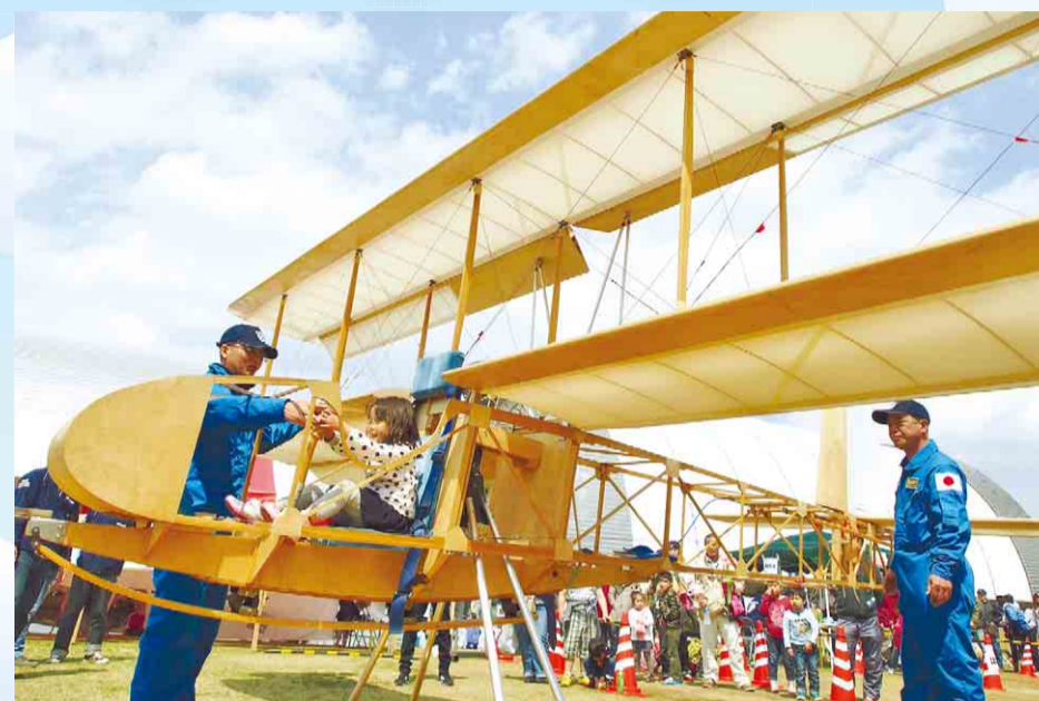
▲市民が集う文化の祭典として開催された『第29回市民文化フェア』。明治44年(1911)に初飛行を行ったアンリ・ファルマン機の実寸大復元機の展示や、手作り飛行機ハヤブサの搭乗体験(写真)、和太鼓フェスティバルなど盛りだくさんの内容で、2日間で約10万人が訪れました。 4月6日(日)／所沢航空記念公園