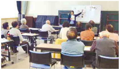
▲介護予防教室の様子

新所沢東地域包括支援センターの実施している介護予防教室では食生活などをテーマに栄養改善を目的としたもの、膝や腰、正しい歩き方をテーマに運動器の機能向上を目的としたものなどを開催しています。