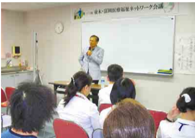
▲医療福祉連携会議の様子

医療機関との連携を強化するため、介護・福祉関係者と医療機関関係者が年に2回以上集い「医療福祉連携会議」を開催し、学習会やグループ討議を行い、交流を深めています。また、介護予防講演会も、地域の医師や歯科医師などの協力を得て開催しています。