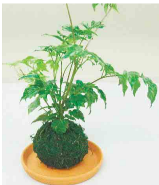
▲苔玉完成イメージ