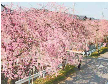
▲砂川堀のしだれ桜 (平成26年度とことこ景観賞)