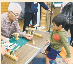
▲紙トンボでできるかな？

展示のほかに子ども向けの工作教室もあり、牛乳パックで作る紙トンボと紙テープで作るイモムシが大人気！親子連れの参加者も大勢集まりました。教えてもらったイモムシを自宅でも作り、翌日見せに来てくれる子どももいて、指導した役員さんもうれしそうでした。