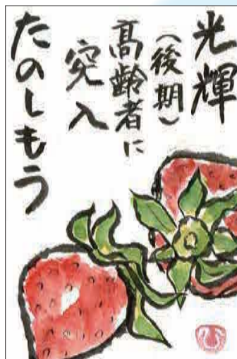
◀いよいよ後期高齢者です 同級生と雑談中、文字を変えただけで気分も変わると結論が出ました ●井上博子（上安松）