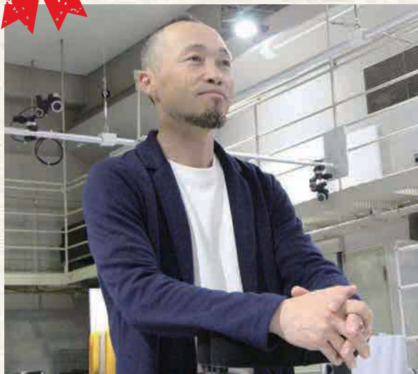
国立障害者リハビリテーションセンター研究所 運動機能系障害研究部 神経筋機能障害研究室長