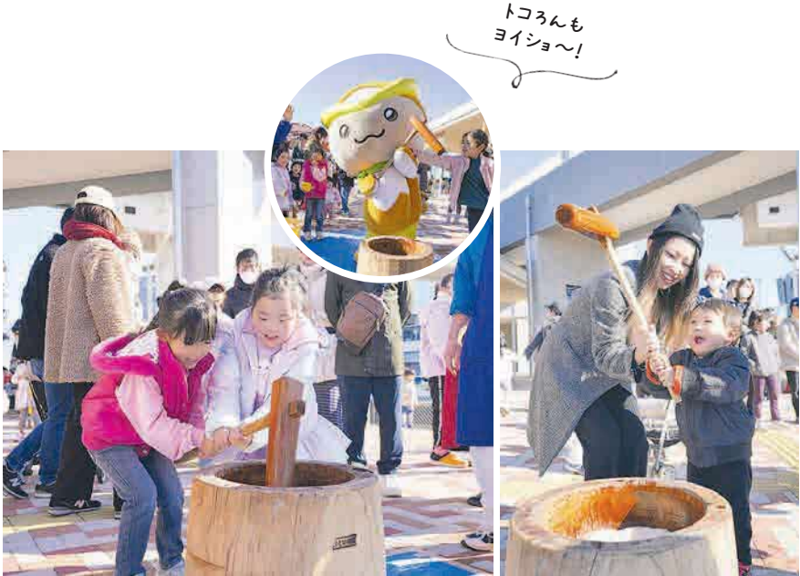
▲昔ながらの杵と臼を使った餅つき体験が、12月28日(日)に観光情報・物産館YOT-TOKOで開催されました。開始前から大勢の方が列を作り、いざ餅つき体験がスタートすると「ヨイショ〜!」という明るい掛け声が響きました。お餅に杵を振り下ろしながら、大人も子どもも笑顔で餅つきをする姿が印象的でした。