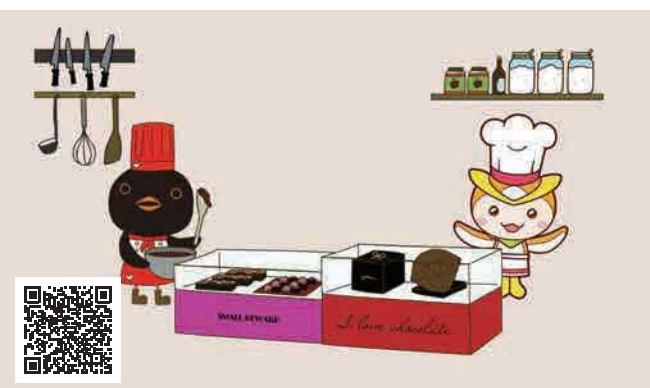
▲市HP（Ｑひばりちゃん）で、壁紙を入手できます。