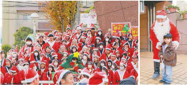
▲12月13日(土)、今年もサンタを探せ!を開催。風の冷たい日でしたが、参加した子どもたちは元気な姿で楽しんでいました。サンタパレードでは、突然現れたサンタたちに、通行人から驚きと歓声が。元町コミュニティ広場では、ガラポン抽選会やステージでの演奏があり、街中が笑顔とにぎわいに包まれていました。