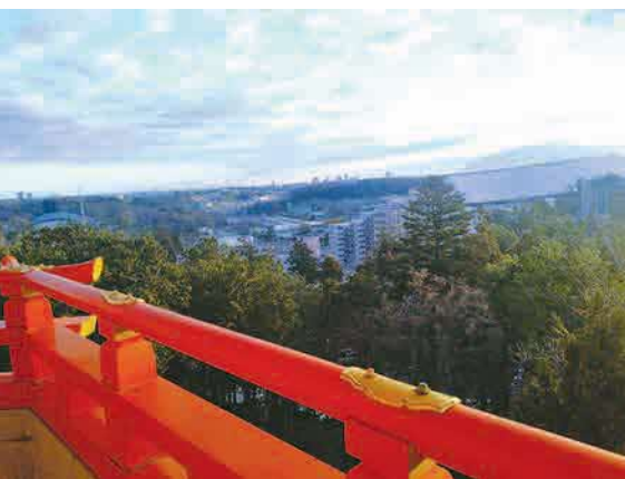
▲初日の出 元旦に金乗院の五重塔に初日の出を見に行きました。新春らしい清々しい朝でした ●抹茶だんご（上山口）