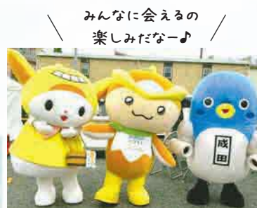
▲はねぴょん(左)、うなりくん(右)