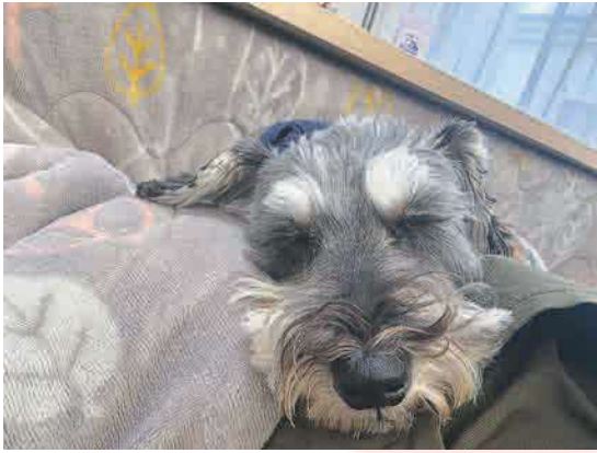
▲こたつでお昼寝 こたつの上でスヤスヤ… ●こむあら（山口）