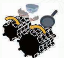
▲破碎機のイメージ図