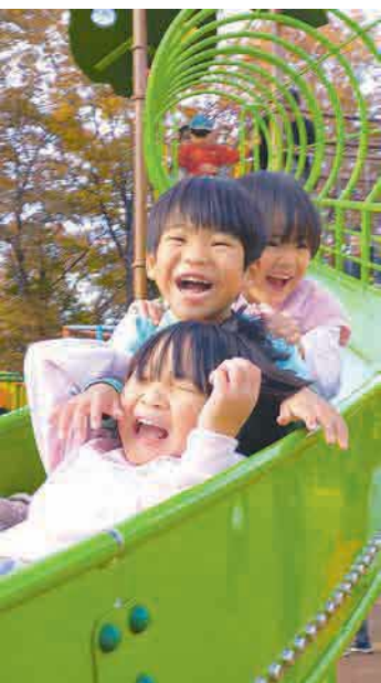
▲楽しいな！ 公園に仲良し三兄妹の元気な笑い声が響きわたります♪ ●メイちゃんパパ（上山口）