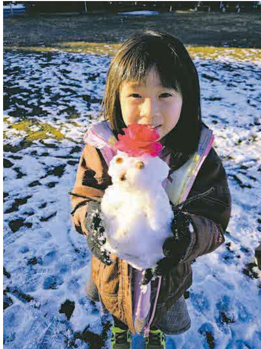
▲雪だるまとハイポーズ！ 今年初めての貴重な雪！雪遊びをたくさん楽しめました！ ●ココナナ（東所沢）