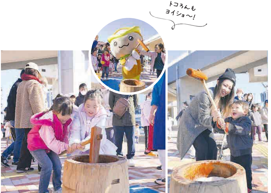
▲昔ながらの杵と臼を使った餅つき体験が、12月28日(日)に観光情報・物産館YOT-TOKOで開催されました。開始前から大勢の方が列を作り、いざ餅つき体験がスタートすると「ヨイショ〜!」という明るい掛け声が響きました。お餅に杵を振り下ろしながら、大人も子どもも笑顔で餅つきをする姿が印象的でした。