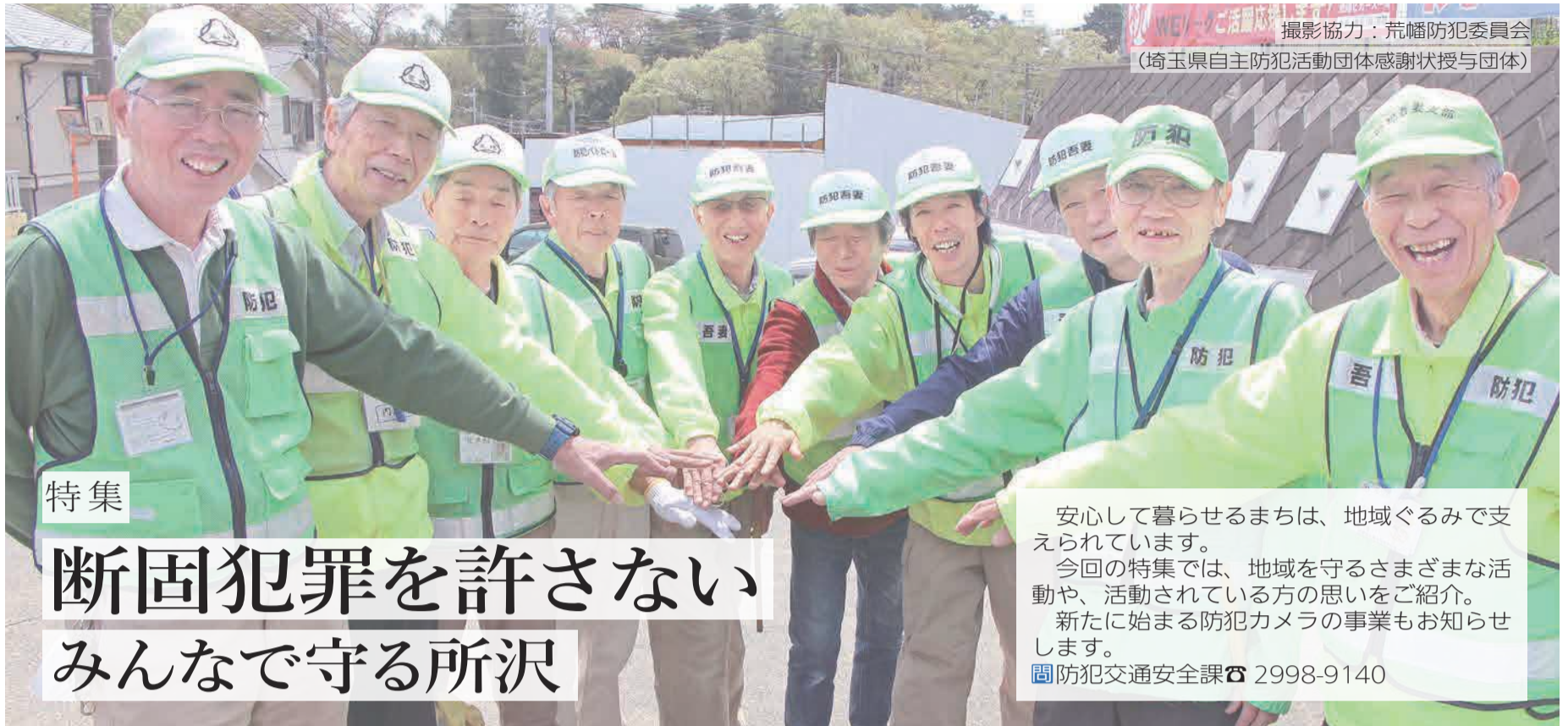
撮影協力：荒幡防犯委員会 (埼玉県自主防犯活動団体感謝状授与団体)