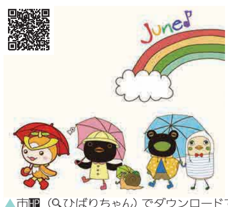
▲市HP(Qひばりちゃん)でダウンロードできます。