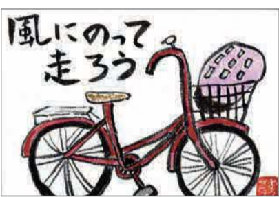
▲遠出したいなあ ルールを守って楽しもう ●梢(東所沢)