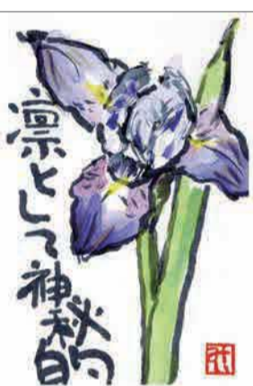
▲アヤメ 昨年いただいた苗がこんなに美しい花に ●田中弘美(牛沼)